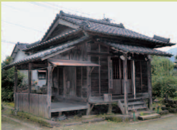
湯前町指定文化財「上里観音堂」 相良三十三観音 二十六番札所