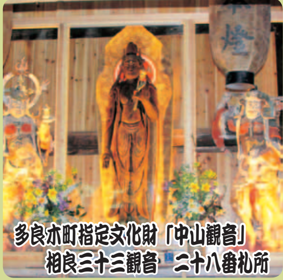
多良木町指定文化財「中山観音」 相良三十三観音 二十八番札所