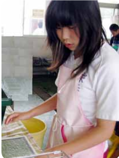
ためすき 竹和紙の紙料を枠ですくって紙の形にする工程です。