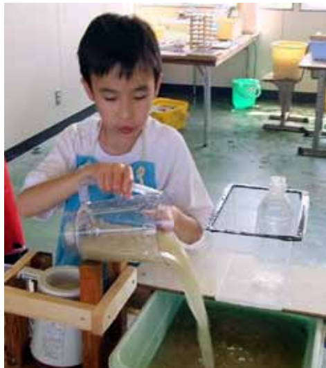
ミキサーで竹の繊維とパルプを混ぜる工程です。