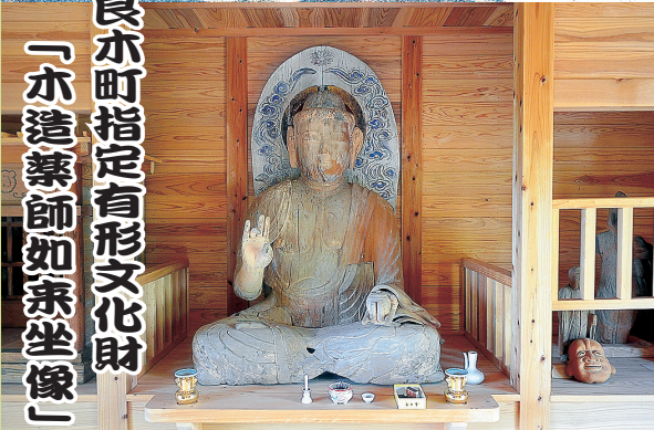
多良木町指定有形文化財 「木造薬師如来坐像」

木造薬師如来坐像（町指定有形文化財）は平安時代後期の作と推定され、ヒノキの一木造りで、像高148cm、膝より下はタブ材で補修されているほか、各部に補修のあとが見られます。明治の初めに岩川内の「堂の門谷」という場所からこの地に移されたと伝わっています。この薬師堂には、南北朝時代の観音菩薩像など数点の仏像が祀られています。