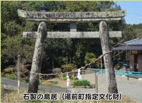
石製の鳥居 (湯前町指定文化財)

安永2年(1773)に描かれた「球磨絵図」には「此社地は郡内最上の一勝地也...執職家東氏領也」とあります。この鳥居は明神型鳥居で、町内に残る唯一の江戸時代の鳥居で安永2年(1773)の銘があります。