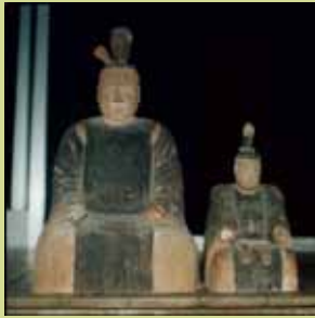
木造神像 (緒方庄右衛門作)