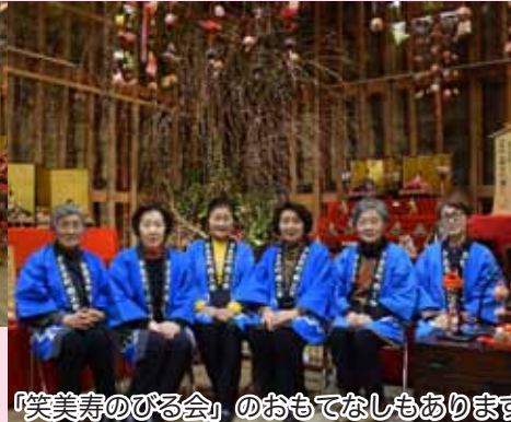
「笑美寿のびる会」のおもてなしもあります