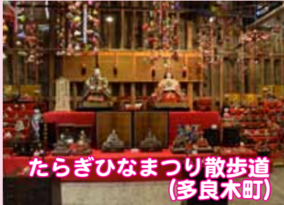
たらぎひなまつり散歩道 (多良木町)