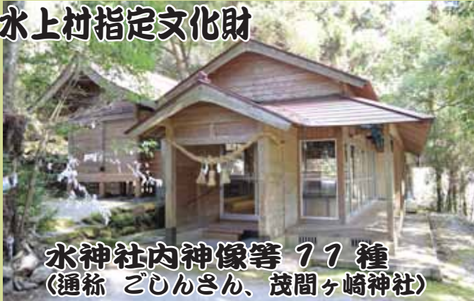
水神社内神像等 77 種 (通称 ごじんさん、茂間ヶ崎神社)