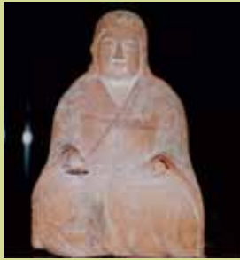
木造玖月善女座像