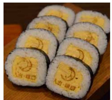
人吉球磨三日月巻き ¥700

使用するお米は自家製米。また具になる卵を贅沢に使用し、卵巻き用に特別に作ったマヨネーズが、全体の味を調べています。老若男女問わず、みなさんが美味しく頂ける1品です。是非ご賞味あれ!