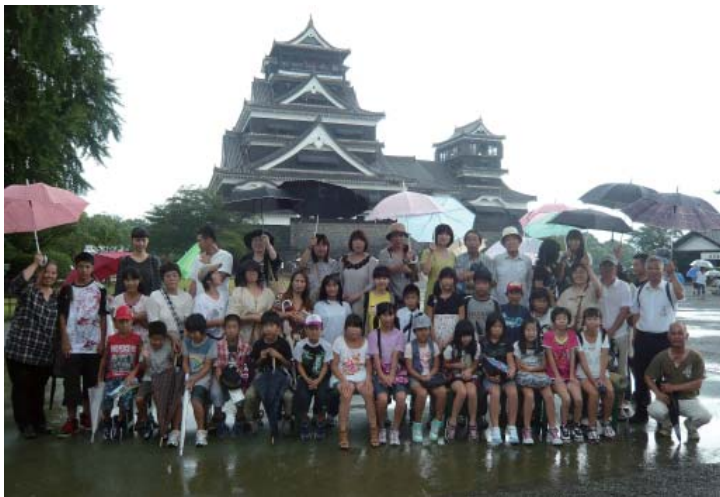
(雨の中参加者みんなで記念撮影)