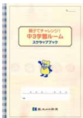
中3学習ルームスクラップブック

[A4判、48ページ] 熊日の気になった記事を、自由に貼付けられるスクラップ帳です。 例)・お子さんやお孫さんのスポーツ(試合)記録用として ・お料理レシピをスクラップして、献立のバリエーションを増やしてみませんか?