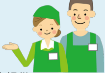
(原稿・写真提供：球磨支援学校)

現場実習を通して得た自分の適性や課題などを、今後の学校生活や進路決定に活かしていきたいと思えます。