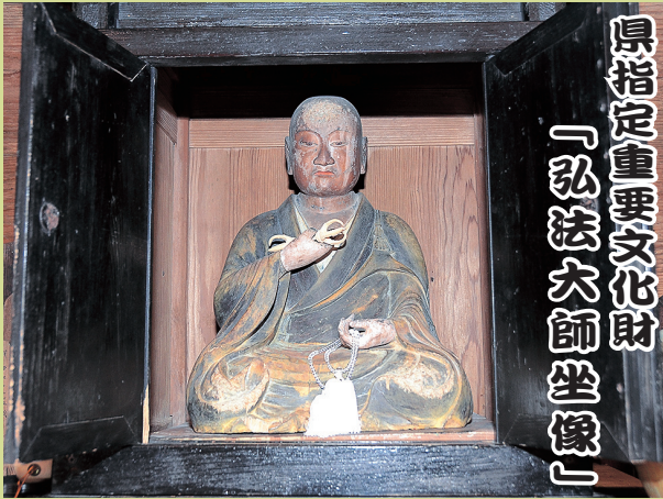
県指定重要文化財 「弘法大師坐像」

多良木町下槻木にある御大師堂の「木造弘法大師坐像」はヒノキの一木造で像高56cmの大師像で各部の均整が整い、面相に気品があります。右手の持ち物の鉢と左手の数珠は失われています。台座墨書によると、応永19年(1412)仏師秀泉の作で、大願主は頼仙である。彫刻年代が明確で、高僧の相を写実的に再現した代表的な作です。