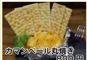
カマンペール丸焼き 800円