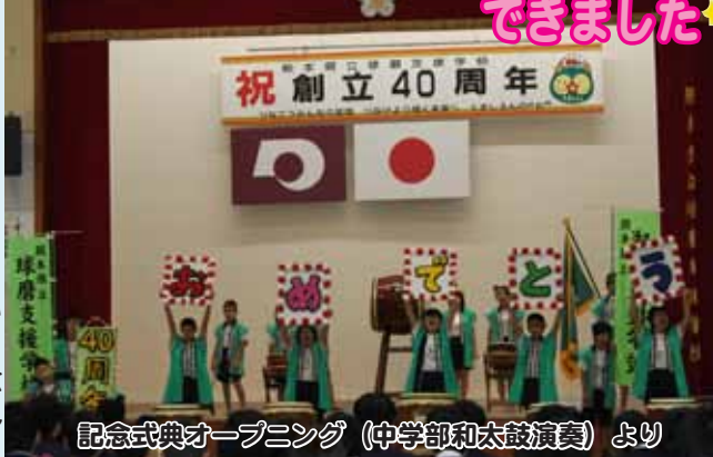
記念式典オープニング(中学部和太鼓演奏)より

第一部の記念式典では、これまで本校を支えていただきました、地域の関係者の方々や歴代の校長先生等に御来校いただき、心温まる御祝辞を賜り、厳粛な中にも心に残る式典を挙行することができました。「わははコンサート1」では、児童生徒、卒業生及び保護者に募集した歌詞で作った40周年記念歌『WA HA HA! 輪! 和!』の披露を行いました。会場からは大きな拍手をいただき、感動のコンサートとなりました。「わははコンサート2」では、福岡県を拠点として活動されている九州打楽器合奏団の方々をお招きし、校歌や40周年記念歌の演奏の他、様々な音色の打楽器の紹介やその打楽器を使って児童生徒も一緒に演奏する機会も設けていただき、楽しいひとときを過ごすことができました。当日は天候にも恵まれ、児童生徒の笑顔が輝く、40周年を祝う記念の日になりました。これまで支えていただきました皆様方へ感謝するとともに、今後も子供たちの自立と豊かな生活の実現を目指し、また、地域の特別支援教育の拠点として、取り組みを進めていきます。(原稿・写真提供：球磨支援学校)