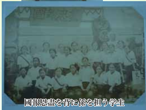
國報恩盡を背に係を担う学生