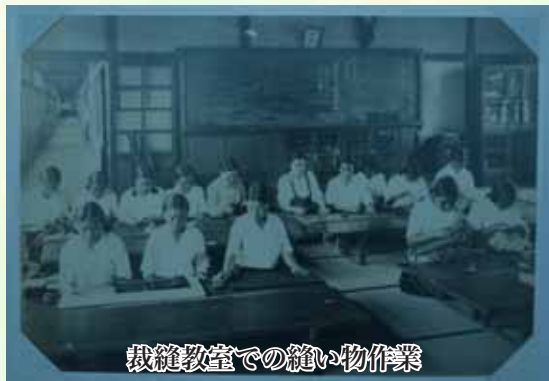
裁縫教室での縫い物作業