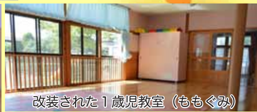
改装された1歳児教室（ももぐみ）