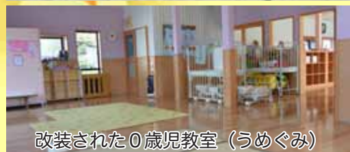
改装された0歳児教室（うめぐみ）