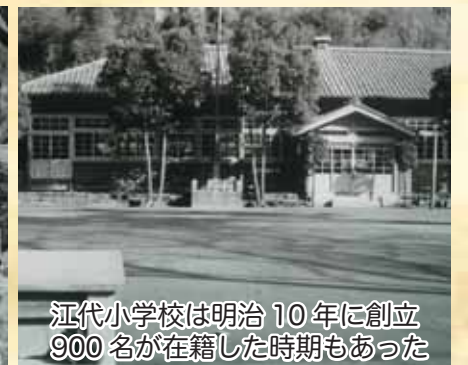
江代小学校は明治10年に創立900名が在籍した時期もあった