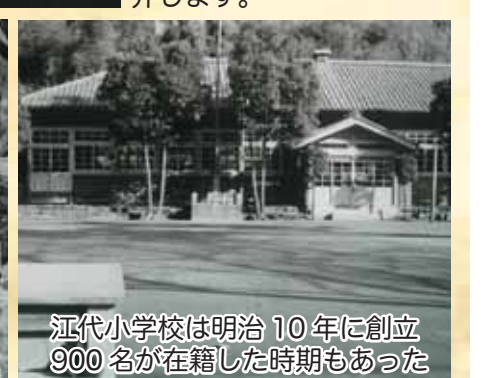
江代小学校は明治10年に創立900名が在籍した時期もあった