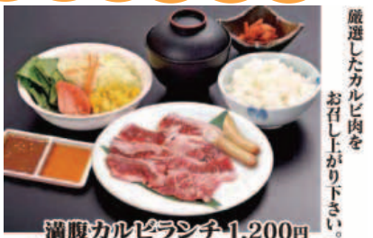
満腹カルビランチ 1,200円