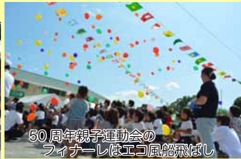
50周年親子運動会のフィナーレはエコ風船飛ばし