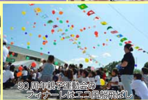
50周年親子運動会のフィナーレはエコ風船飛ばし