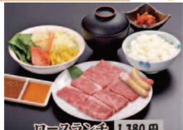
柔らかく肉の旨味がじわっと広がります。