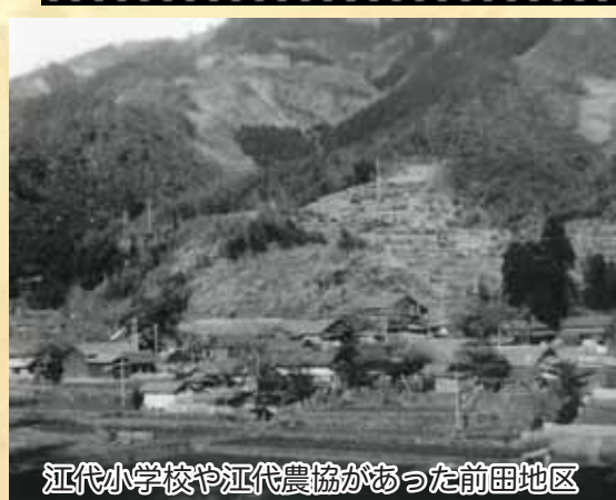
江代小学校や江代農協があった前田地区

昭和35年に市房ダムが完成して、江代、湯山の一部約200世帯の住民が苦渋の選択を迫られこの地を離れ、各々の別天地を求めて離れ離れとなり、多くの軌跡を乗り越えて約60年の月日が流れようとしています。今回はダムの建設によって、江代小学校や江代農協などが水没した前田地区（現在、八幡神社があるところ附近）の写真を紹介いたします。