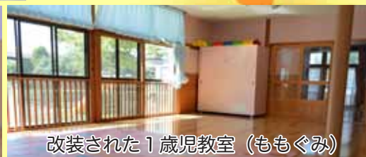
改装された1歳児教室（ももぐみ）