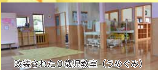
改装された0歳児教室（うめぐみ）