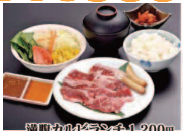
厳選したカルビ肉をお召し上がり下さい。