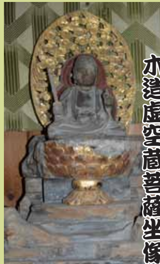
多良木町指定有形文化財 虚空蔵菩薩坐像

寛正6年(1465)この地に建立された元黒肥地寺の本尊である虚空蔵菩薩坐像は、櫃の一木造り、彫眼。像高28cm。台座墨書銘には「当郡主相良之長統嫡子為統同多良木殿頼泰・・・別者千里内幸之仏師慧麟作・・・黒肥地寺」とあります。堂の前には北目街道が東西に走り、中世的景観が広がっています。