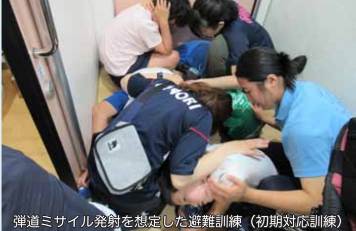
弾道ミサイル発射を想定した避難訓練 (初期対応訓練)

本校では、通常の避難訓練に加えて、毎月、地震・火災及び弾道ミサイル発射時における「初期対応訓練」を実施しております。「初期対応訓練」とは、それぞれの災害時における最初の避難行動(身をを守る行動)の訓練です。