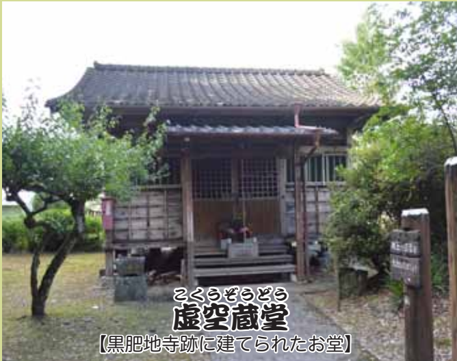
くろうぞうぞう 虚空蔵堂 【黒肥地寺跡に建てられたお堂】

寛正6年(1465)この地に建立された元黒肥地寺の本尊である虚空蔵菩薩坐像は、櫃の一木造り、彫眼。像高28cm。台座墨書銘には「当郡主相良之長統嫡子為統同多良木殿頼泰・・・別者千里内幸之仏師慧麟作・・・黒肥地寺」とあります。堂の前には北目街道が東西に走り、中世的景観が広がっています。