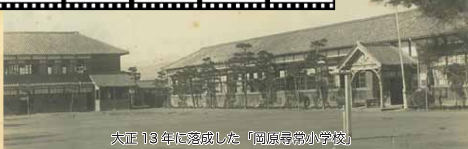
大正13年に落成した「岡原尋常小学校」

茶ヤン木戸...と愛称され古びた消防用ポンプ格納庫があり、広場は子供たちの遊び場として愛用された思い出の場所だ。「陣取り合戦」「瓦倒し」などの遊びに興じ、日の暮れるのも忘れるものだった。