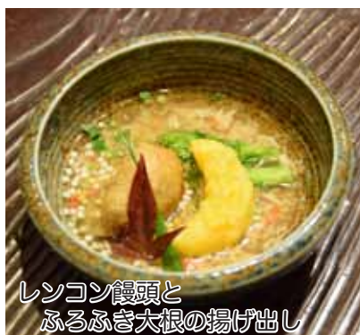
レンコン饅頭と ふるふる大根の揚げ出し 三日月仕立て ¥680

「人吉・球磨 風水・祈りの浄化町」のブランド戦略に沿って、人吉球磨のさまざまな事業者等が、三日月商品の開発に取り組み始められています。それらを少しずつ紹介していきます。