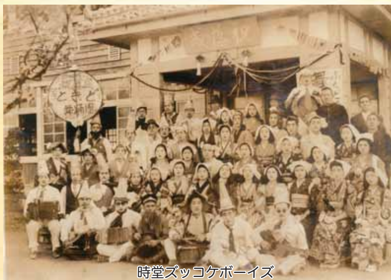
時堂ズッコケボーイズ

昭和24年4月3日、岡原中学校校舎落成式が行われました。当時は落成式や村祭りの際には、村人総出で余興を催し祝っていました。齊堂地区は「時堂ズッコケボーイズ」と称し、仮装して演出し賑やかな行事となりました。