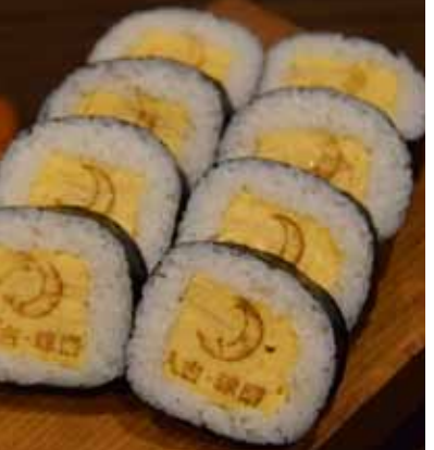
人吉球磨三日月巻き ¥700

人吉球磨のさまざまな事業者等が、三日月商品の開発に取り組み始められています。今回紹介するのは、