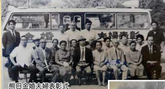
熊目金婚夫婦表彰式