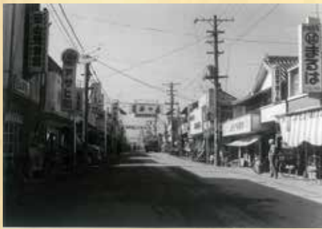
田山理容館、衣料百貨まるは、とらや製菓舗などの看板が写っている。