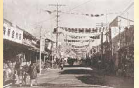
多良木駅前交差点附近から撮った、昭和30年頃の商店街の様子。