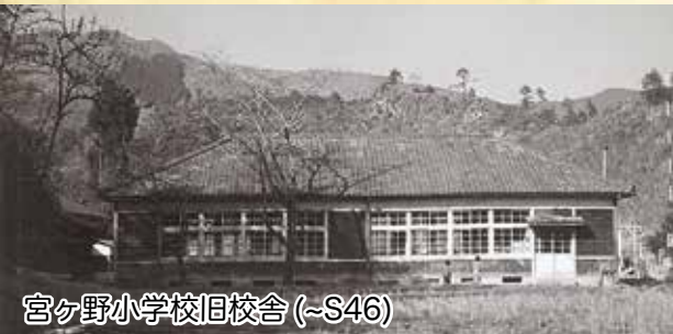
宮ヶ野小学校旧校舎 (~S46)