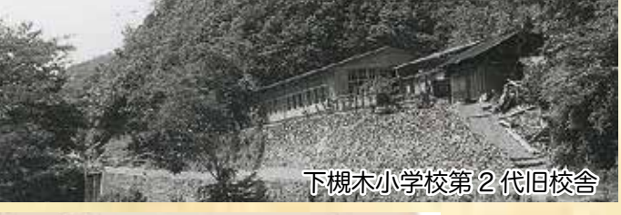
下槻木小学校第2代旧校舎