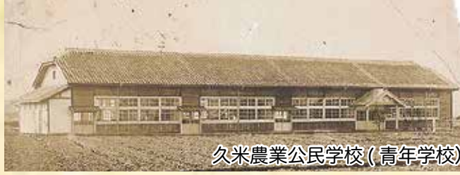
久米農業公民学校(青年学校)