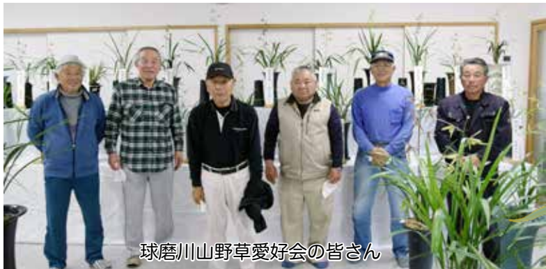
球磨川山野草愛好会の皆さん