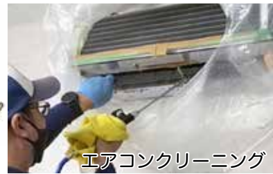
エアコンクリーニング